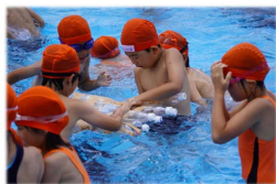
2年1組 プールに浮かぶ船をつくろう

まずは、2年1組さんです。生活科で「プールに浮かぶ船を作ろう」という学習に取り組みました。水に浮く材料はペットボトルだと気づいたお友だちの意見をもとに、家にあるペットボトルを教室に持ち寄りました。今牧先生は豊丘南小学校の先生方にも協力をお願いしました。私も、20本ばかり協力させてもらいました。どんな形の船が浮きやすいのか、ペットボトル同士をどうやったら頑丈にくっつけられるのかなど、みんなで知恵を出し合いながら作っていったそうです。そして、完成した船は、水泳の時間にプールに浮かべます。浮かべるだけでは物足りないお友だちは、その船の上に乗船したようです。その結果どうだったかは、2年1組のお友だちに聞いてください。クラスのみんなで協力して、ひとつのものを作り上げる勉強っていいですね。